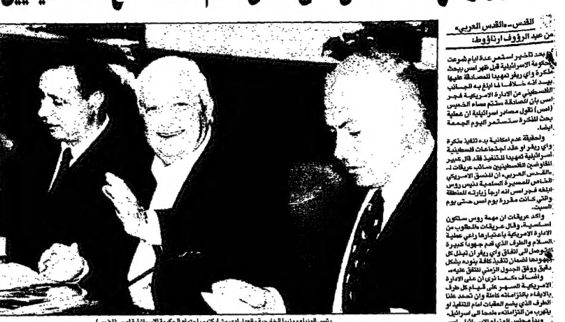
رئيس الوزراء يئزرعك ووزير الخارجية شيمون بيريز يقران اقرار اتفاق واي بلانتيشن

غزة - عرفات - قال عرفات إن مجلس الوزراء الاسرائيلي يبحث اقرار اتفاق واي بلانتيشن. وقال عرفات إن الفلسطينيين يريدون السلام، ولكنهم يريدون أيضا ضمان حقوقهم في تقرير المصير.